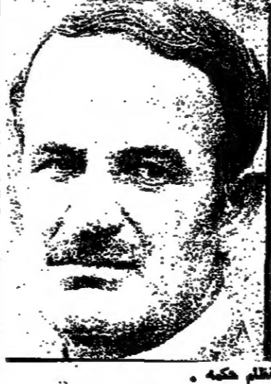
البنية على ص ٨ ع ٧